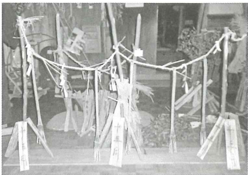
郷土館復元農家前の門松

旧正月には、伝統的な祀りものが数々あり、中でも門松や神棚などいろいろな所に祀られるものとしてニユウギがある。このニユウギはクリ・カシなどの木を割って作り、平年は「十二月」、閏年は「十二月」と書く。ニユウギは新木(にいぎ)の転のようである(広辞苑より)。