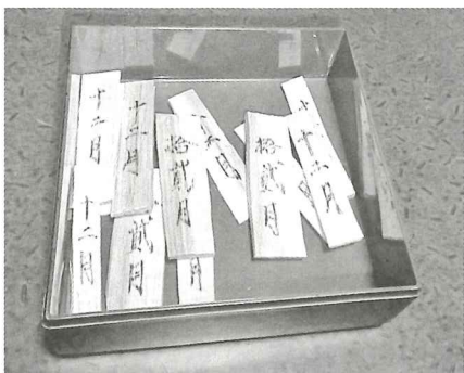
むしよ参りに使う小ニユウギ

なニユウギを用意し、組内や村内の墓や野仏を有縁無縁の別なく拜んで回った。「上粟代の日記、旧正月十五日の項に『墓所参り』と記述されている。墓所は古い表現で『むしよ』と読む。このことから『むしよ参り』は『墓所(むしよ)参り』の転と思われる。」と書かれている。